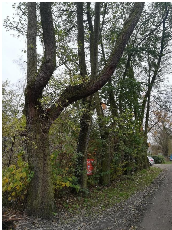
Zdjęcie nr 2. Ulica Lipowa