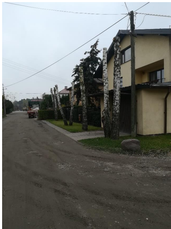
Zdjęcie nr 5. Ulica Olszowa