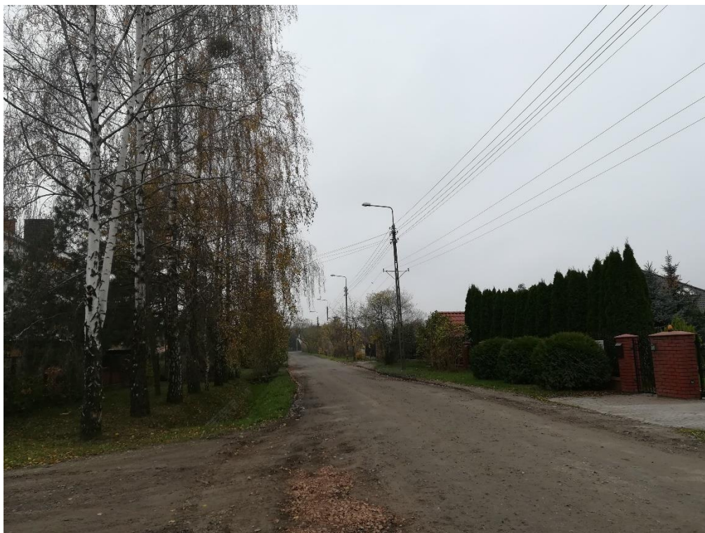
Zdjęcie nr 1. Ulica Lipowa