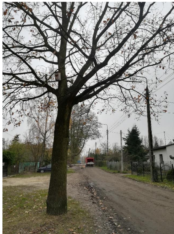
Zdjęcie nr 3. Ulica Lipowa