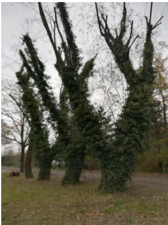
Zdjęcie nr 4. Ulica Lipowa