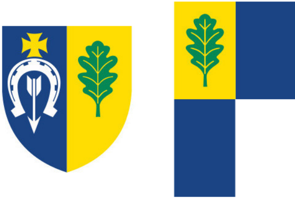
Herb i flaga Milanówka

Herb Milanówka ma tarczę dwudzielną w słup. W polu prawym o barwie błękitnej przedstawia srebrną podkowę ze złotym krzyżem maltańskim w barku, wewnątrz podkowy srebrna strzała skierowana grotem w dół. W polu lewym o barwie żółtej zielony liść dębu w słup. Obecny wzór herbu Milanówka zatwierdzono 10 czerwca 1997 r. uchwałą Rady Miasta nr 157/XLVI/97.